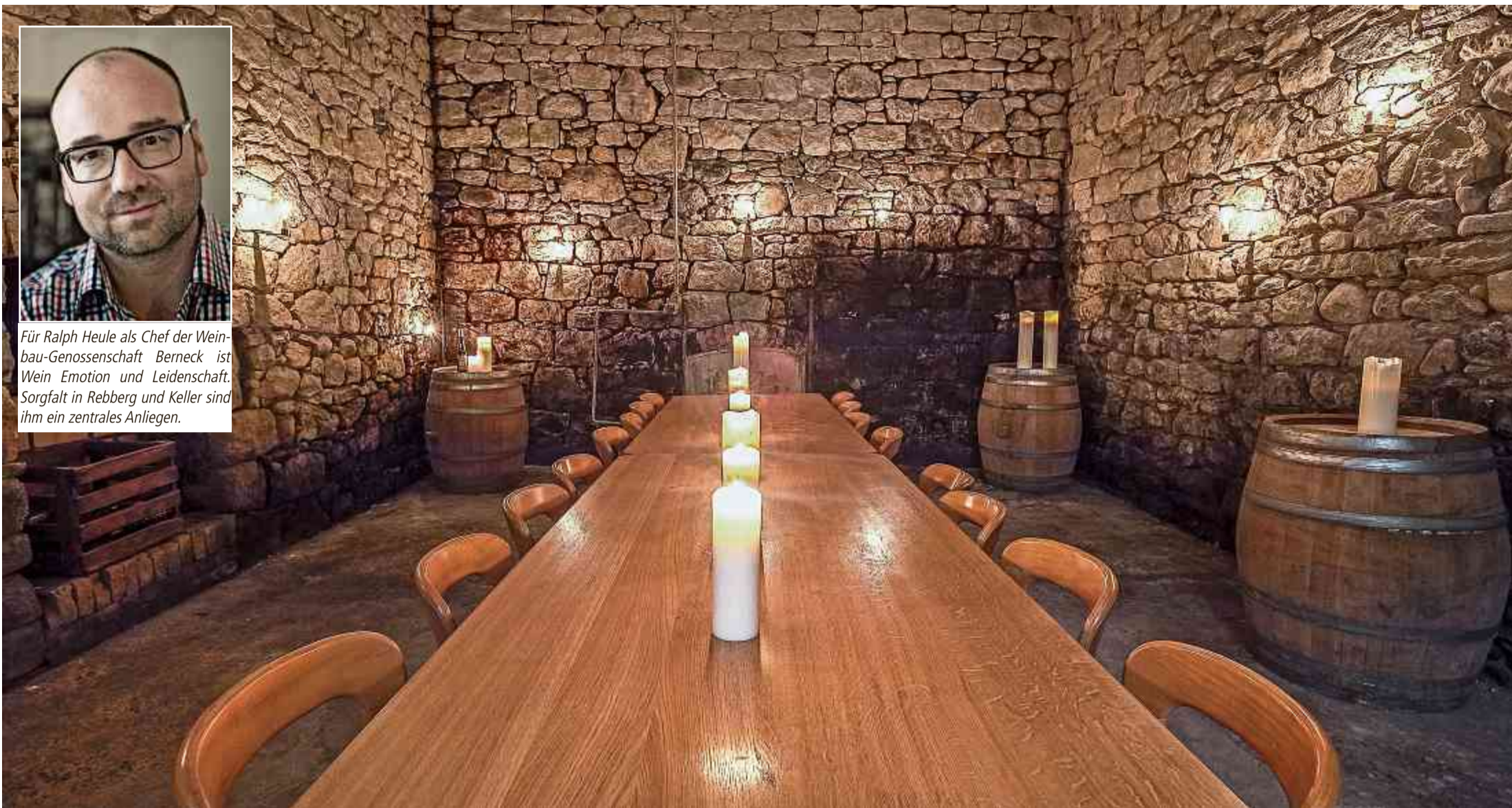
WEIN BERNECK am Rathausplatz verfügt nicht nur über ein stimmungsvolles Verkaufslokal mit grosser Apéro-Bar, welches ausser Sonntag jeden Tag geöffnet ist (Mo–Fr 17.00–20.00, Sa 09.00–12.00). Man kann sich auch im tiefen Keller bei Kerzenlicht den Genuss- und Sinnesfreuden hingeben (auf Anfrage 071 744 24 13).