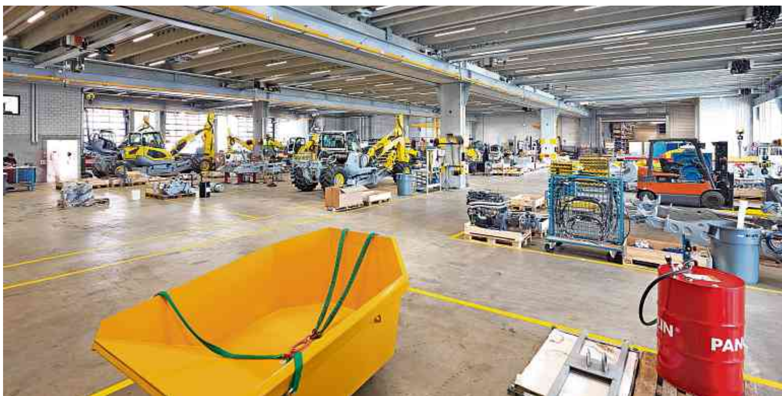
Produktion MenziMuck im Erdgeschoss.