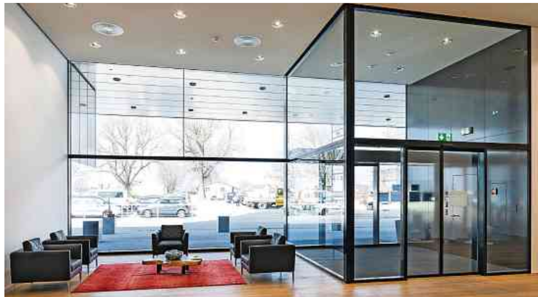
Haupteingang mit Windfang.

haben mit unser Lösung den Zuschlag der Bauherrschaft erhalten und konnten an die weitere Planung gehen.