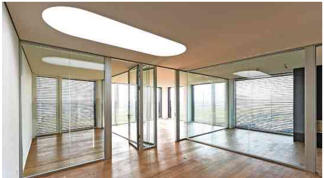
Bilder: Hannes Thalmann