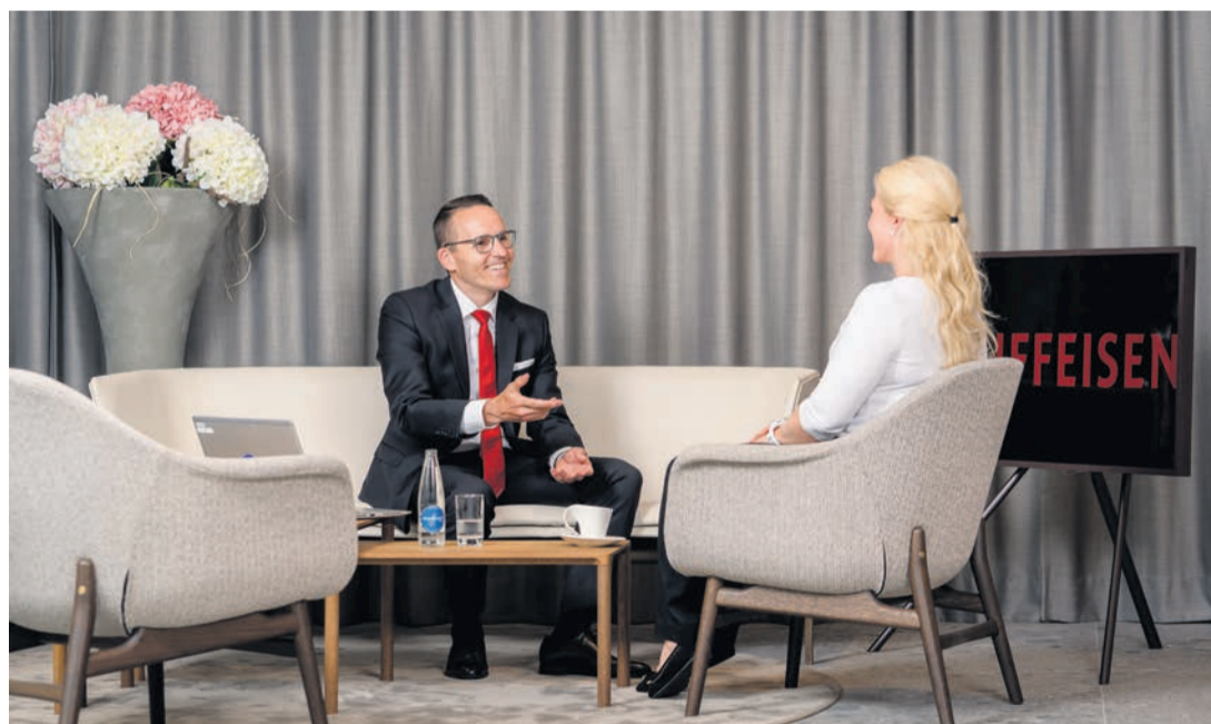
Die Beratungslounge für Gespräche in gemütlicher Atmosphäre.