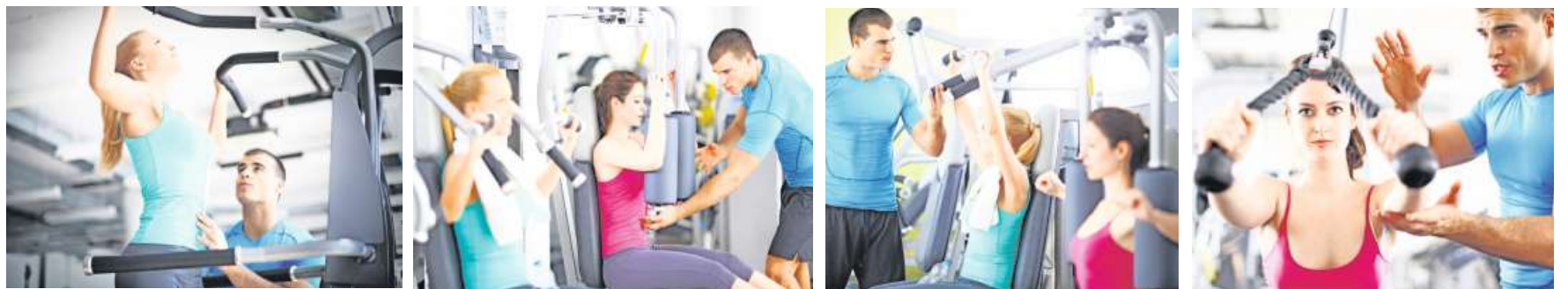
In den Fitnesscentern Nöllen können Sie Ihr Abo monatlich, vierteljährlich oder innert 30 Tagen bezahlen. So, wie es für Sie am besten passt.

www.fitnessnoellen-widnau.ch www.fitnessnoellen-altstaetten.ch www.facebook.com/fitness.ch