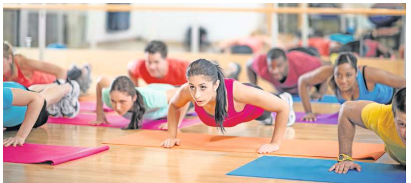
Gruppenfitness im Nöllen: Jetzt anrufen und an 10 aufeinanderfolgenden Tagen ohne Risiko ausprobieren.