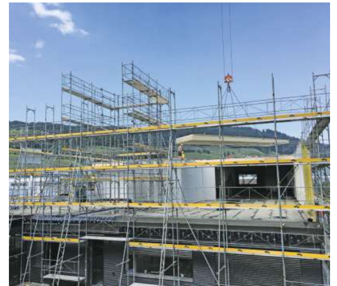
Dank des guten Wetters kommen die Bauarbeiten gut voran.