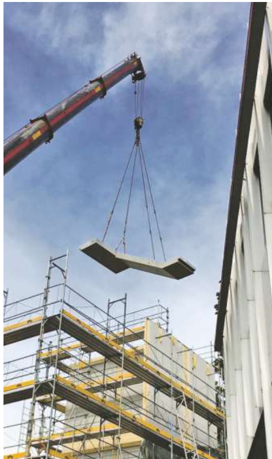
Der Kran fügt die Betontreppe als Fertigelement ein.

Das in der zweiten Generation geführte Unternehmen wurde bereits mehrfach ausgezeichnet. 2016 mit dem begehrten Rheintaler Wirtschaftspreis und sechs Jahre zuvor mit dem SVC Unternehmerpreis Ostschweiz.