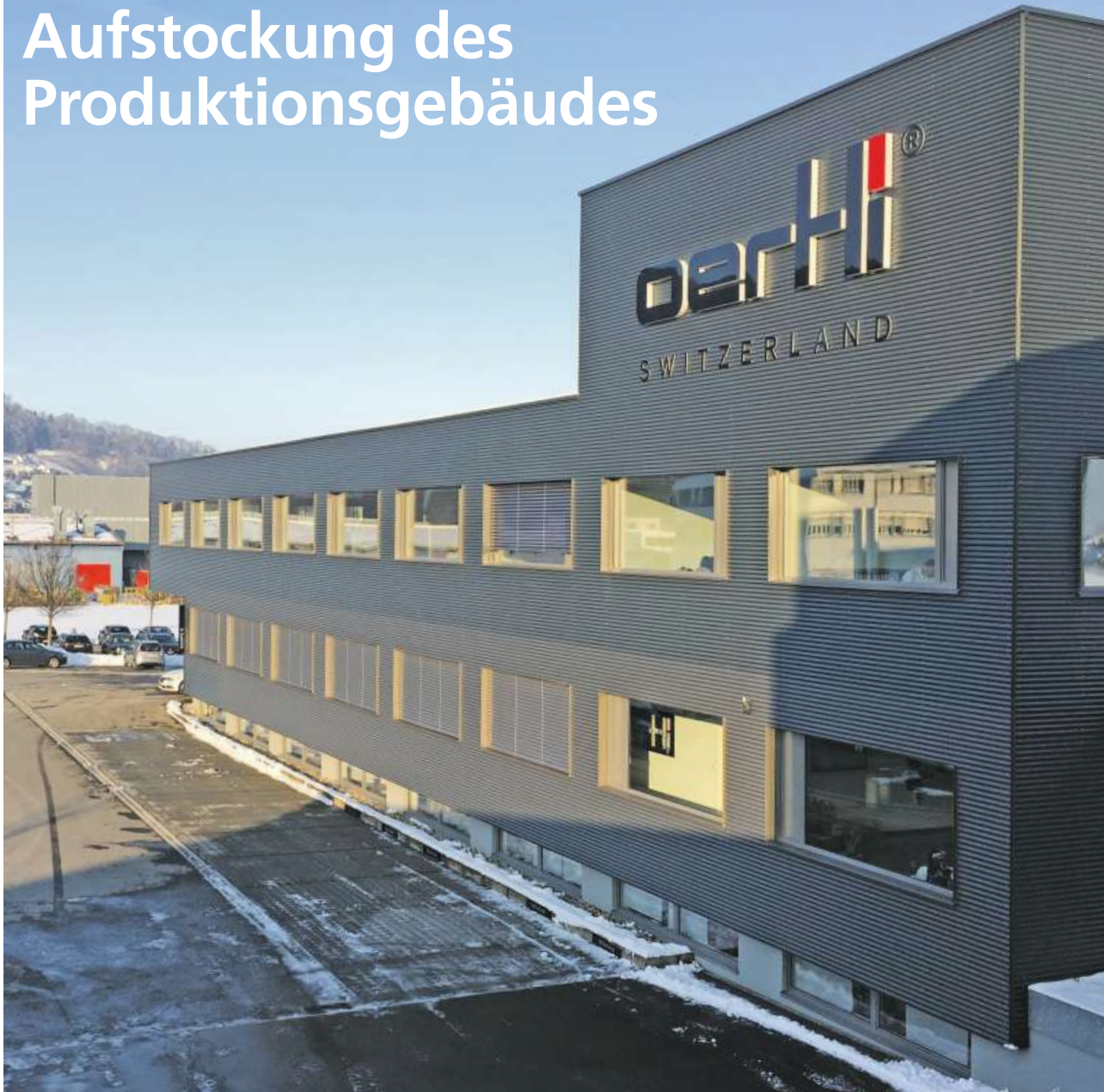
Die einjährige Bauphase hat sich gelohnt.