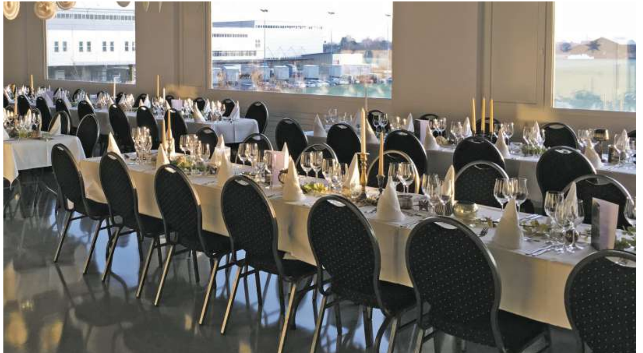
Das neue Obergeschoss wurde feierlich mit der Weihnachtsfeier eingeweiht.