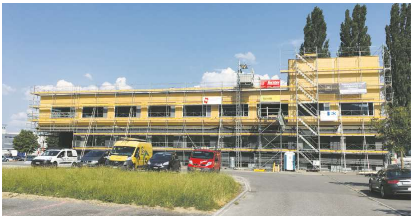
Alle Holzelemente sind montiert.