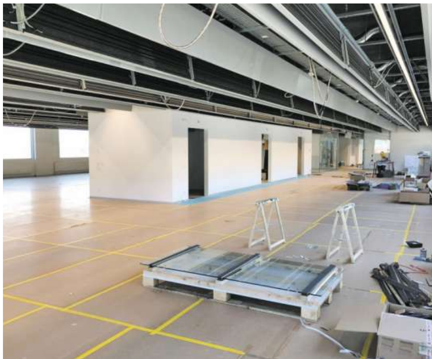
Der Innenausbau kurz vor der Fertigstellung.