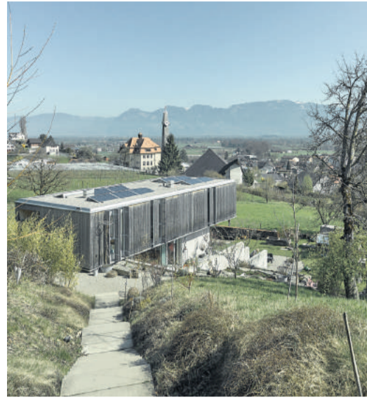
Blick von Lüdingen übers Rheintal