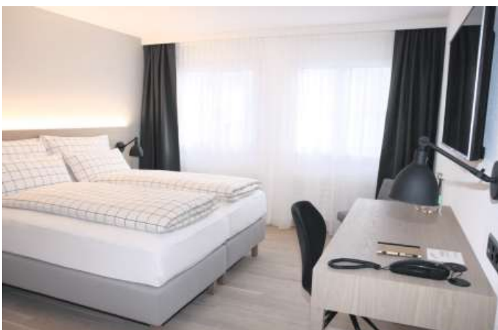
Moderne Hotelzimmer mit Boxspringbetten.