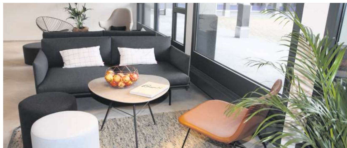
Gemütliche Atmosphäre im neuen Empfangsraum.