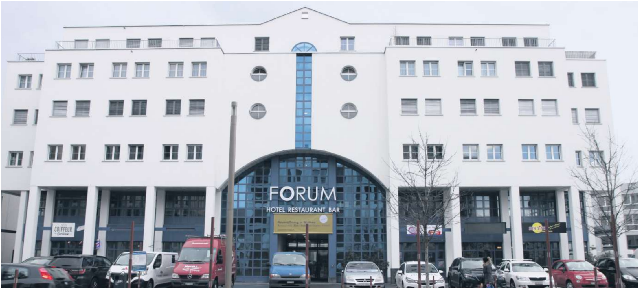
Das Hotel Restaurant Forum ist seit Montag wieder offen.