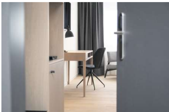
Ein Blick in ein neu renoviertes Zimmer.