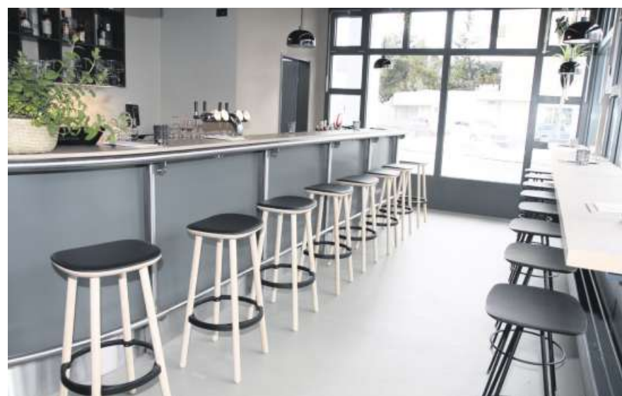
Einladend auch die neue eingerichtete Bar.