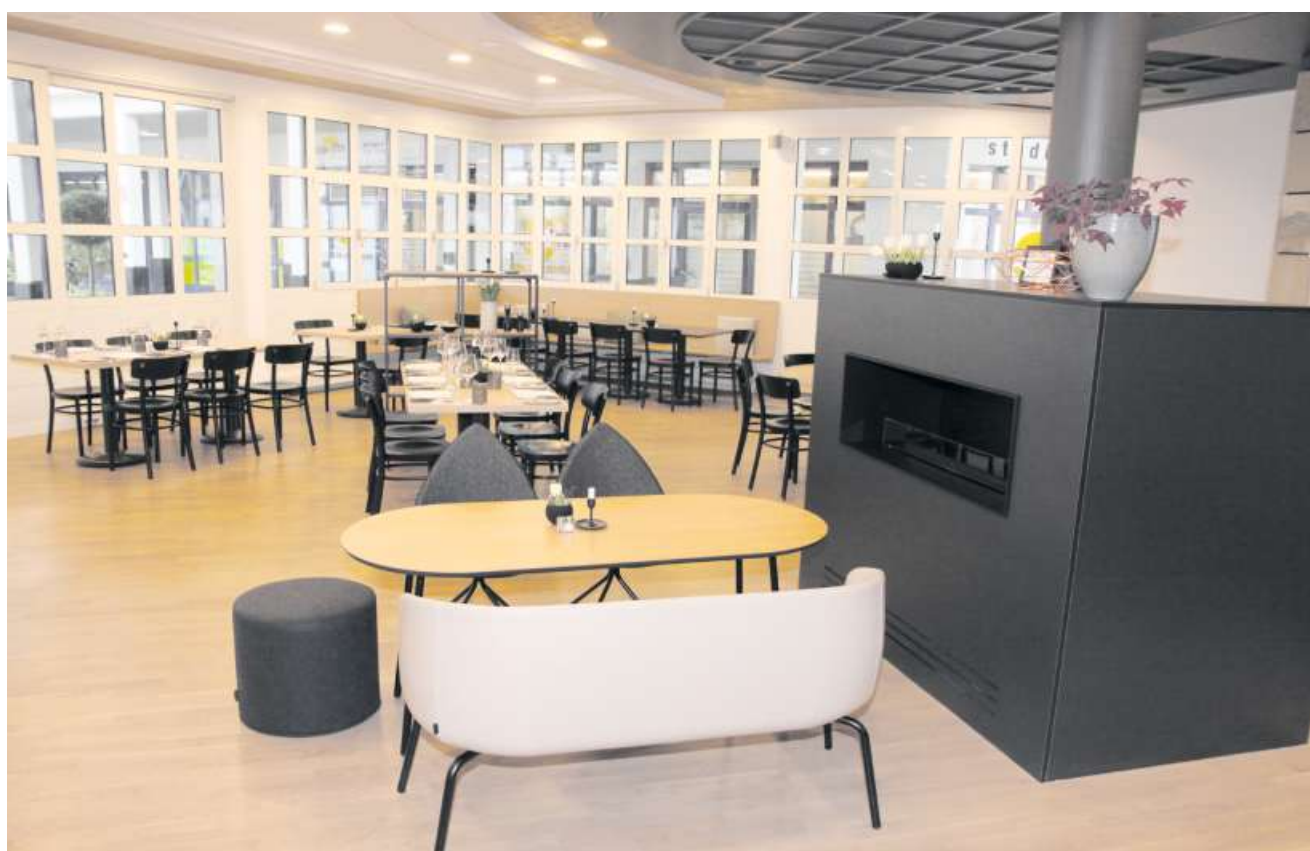
Das neue Innenleben im Restaurant überzeugt mit speziellem Ambiente.

Geplant ist auch eine Smokerbox, wo auch feine Zigarren geraucht werden können. Der Innenhof wird sich bald in eine urbane, grüne Oase mit toller Möblierung und viel Holz verwandeln. Es soll ein Ort zum Wohlfühlen sein.