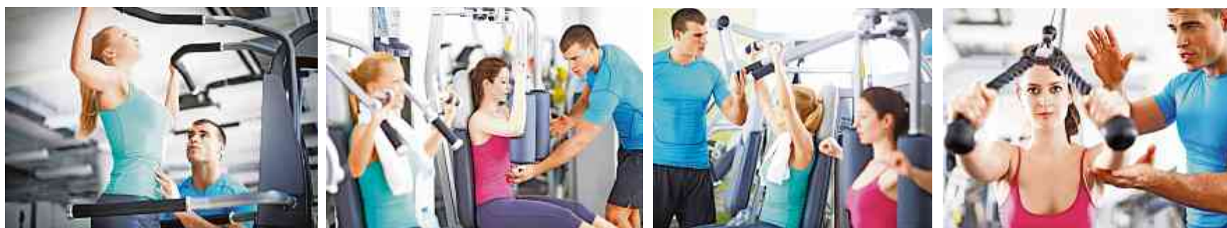
In den Fitnesscentern Nöllen können Sie Ihr Abo monatlich, vierteljährlich oder innert 30 Tagen bezahlen. So wie es für Sie am besten passt.

www.fitnessnoellen-widnau.ch www.fitnessnoellen-altstaetten.ch www.facebook.com/fitness.ch