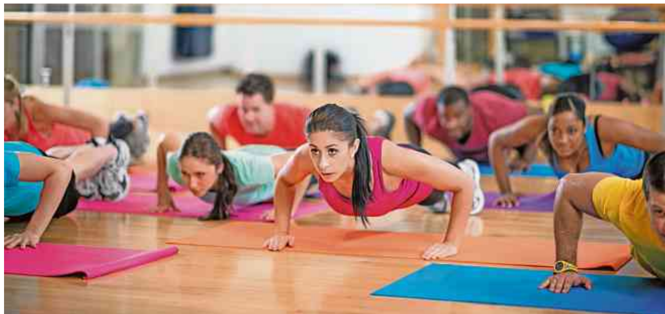
Gruppenfitness im Nöllen: Jetzt anrufen und bis 31. August 2016 ohne Risiko ausprobieren.