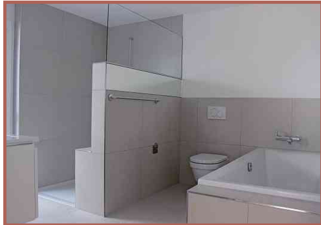
Dusche, Bad, WC – hell und grosszügig.