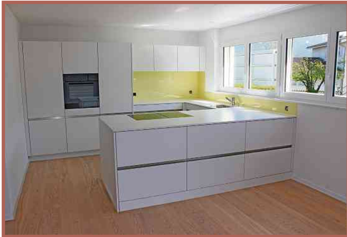
Die Küche bietet höchsten Komfort.