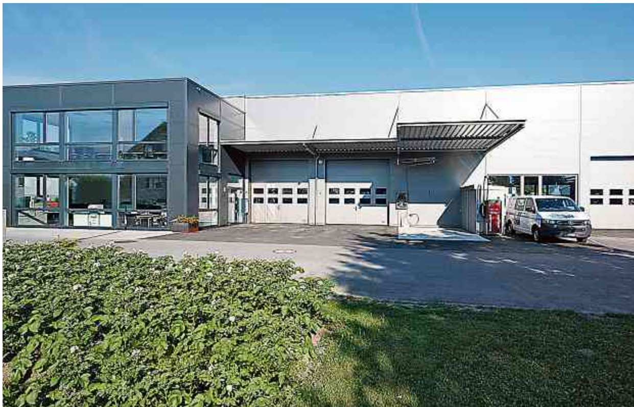
Neubau Lager- und Produktionsräume und Büros.