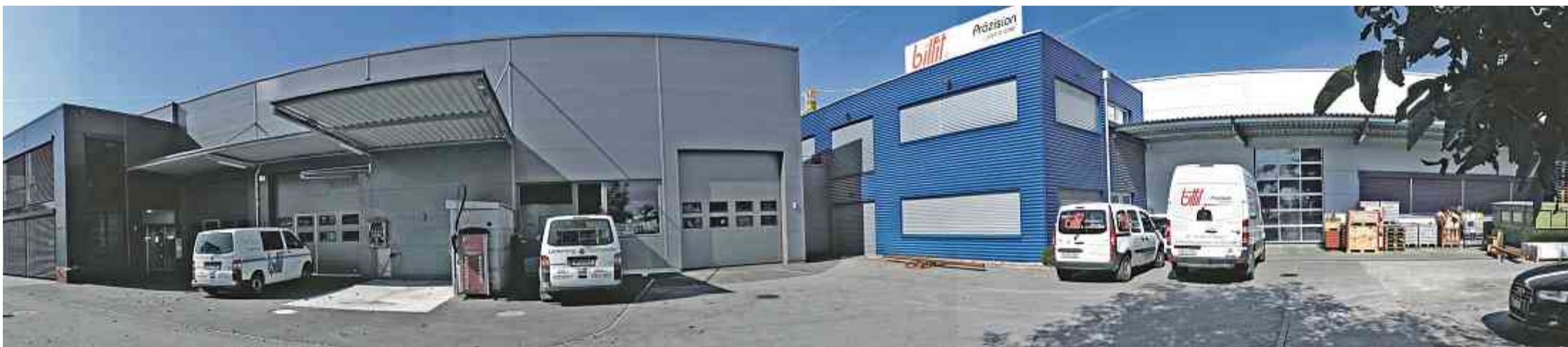
Die Bilfit Technik AG lädt am Samstag, 25. Oktober, zum «Tag der offenen Tür» in das neue Firmengebäude an der Falbenstrasse 1a in Diepoldsau.