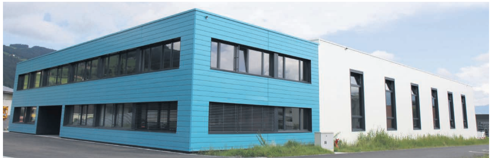
Das zweigeschossige Produktionsgebäude mit Bürotrakt.

Beim Neubau handelt es sich um ein zweigeschossiges Produktionsgebäude mit Bürotrakt. Im Erdgeschoss befinden sich die grosse Produktionshalle sowie