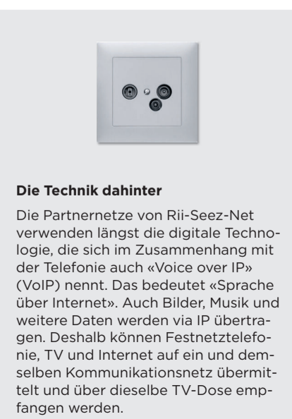
Die Technik dahinter

Nein, das haben sie nicht. Sie können weiterhin telefonieren wie bis anhin. Rii-Seez-Net verbreitet seit jeher digitale Signale. Wer noch einen alten Festnetzanschluss besitzt, wechselt am besten gleich zu Rii-Seez-Net. Der Wechsel ist problemlos, und man kann die Telefonnummer behalten. Rii-Seez-Net kümmert sich um alle administrativen und technischen Belange des Wechsels.