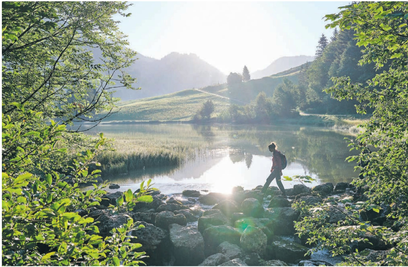
Wandern in unberührter Bregenzerwälder Berglandschaft.

Wer gerne unvergessliche Bergerlebnisse mit kulinarischen Genüssen kombiniert sowie Bade- und Wellnessangebote schätzt, wer Wert auf gepflegte Gastlichkeit und einfallsreiche Architektur legt, urlaubt im Bregenzerwald richtig. Denn genussvolle Bewegung in der facettenreichen Natur lässt sich hier bestens mit Inspirierendem und Verwöhnendem kombinieren.