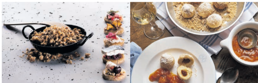
Vom Einfallsreichtum der Bregenzerwälder Küche zeugen köstliche «Ribel-Tapas» (links) und Topfenknödel mit Sig und Marillenröster gefüllt.

Der 18-Loch-Golfpark Bregenzerwald in Riefensberg-Sulzberg liegt im hügeligen Norden des Bregenzerwaldes an der deutschen Grenze. Um Golfer*innen noch mehr Abwechslung zu ermöglichen, kooperiert er mit dem 18-Loch-Golfplatz Oberstaufen-Steibis im benachbarten Allgäu. Gemeinsam bieten sie Sonderkonditionen bei den Greenfees und in Zusammenarbeit mit Partner-Golfhotels an. Kurse können über die Golfschule Bregenzerwald gebucht werden. Das Angebot reicht von Tipps zum Schwung und zur Spielstrategie bis zum Mentaltraining. Idealer Standort ist das Wellnesshotel Linde in Sulzberg. (pd)