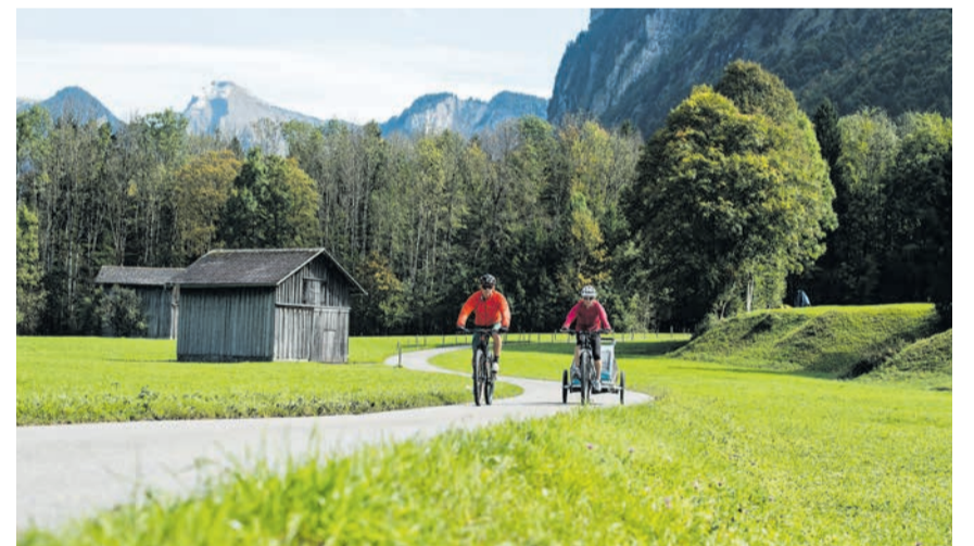
Der Radweg liegt direkt an den Mellauer Bergbahnen und dem Wellnesshotel «Die Wälderin».