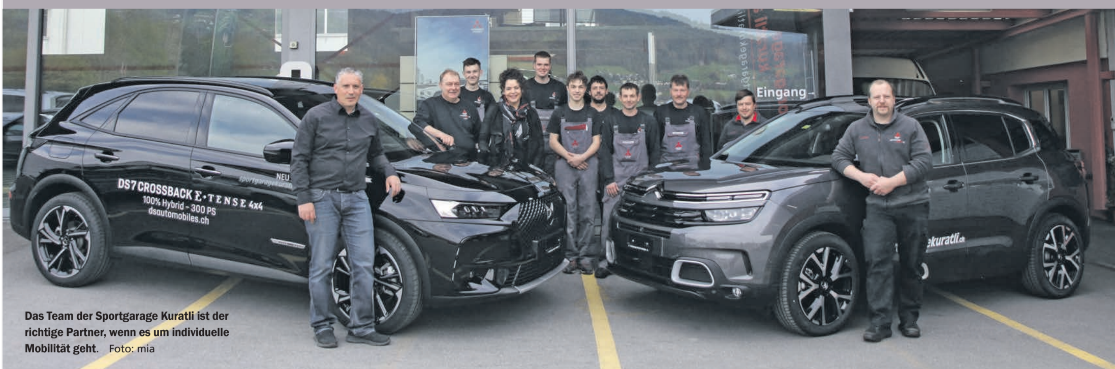
Das Team der Sportgarage Kuratli ist der richtige Partner, wenn es um individuelle Mobilität geht.