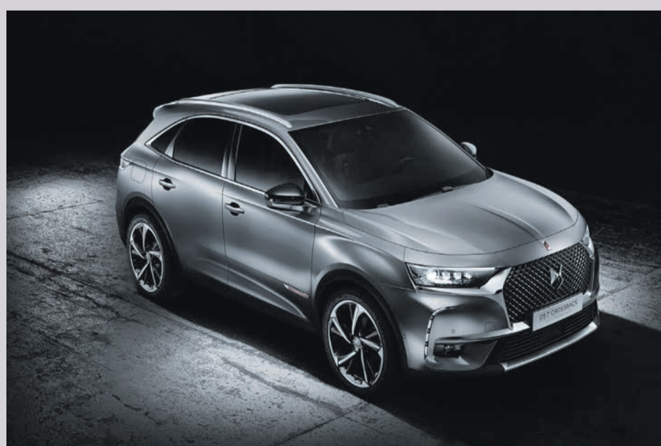
Der DS 7 Crossback E-TENSE 4x4 vereint zwei Elektromotoren, einen Verbrennungsmotor sowie eine wiederaufladbare Batterie. Das Resultat: 220 kW/300 PS, Allradantrieb mit 8-Gang-Automatikgetriebe, 52 Kilometer Reichweite (WLTP-Testzyklus), Null-Emissions-Modus und die Möglichkeit, die Batterie in ca. 3:30 h an einer Wallbox aufzuladen.