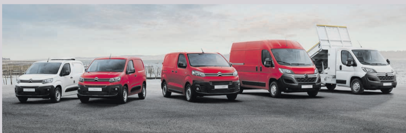
Die Nutzfahrzeuge Modelle Berlingo, Jumpy und Jumper sind problemlos ausbaubar und werden den gewerblichen Anforderungen aller Branchen gerecht. Ob Einzelhandel, Kleingewerbe oder Baubranche – überlassen Sie nichts dem Zufall und setzen Sie auf einen vertrauensvollen Hersteller, um Ihren beruflichen Alltag so angenehm wie möglich zu gestalten.